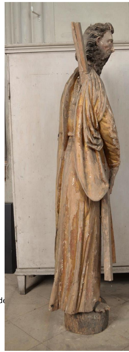
Socha sv. Ondřeje z kostela Sv. Jakuba v Poličce.