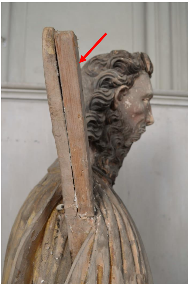
Základní korpus sochy sestává z jednoho kusu dřeva, některé drobnější části draperie, či kříže jsou dosazeny. Zde: vsazená část kříže.