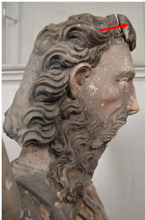
Vsazené kučery nad čelem.